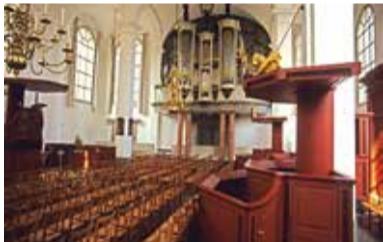
Zo werd het ...