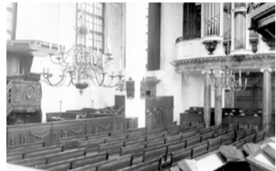
Zo was het ...