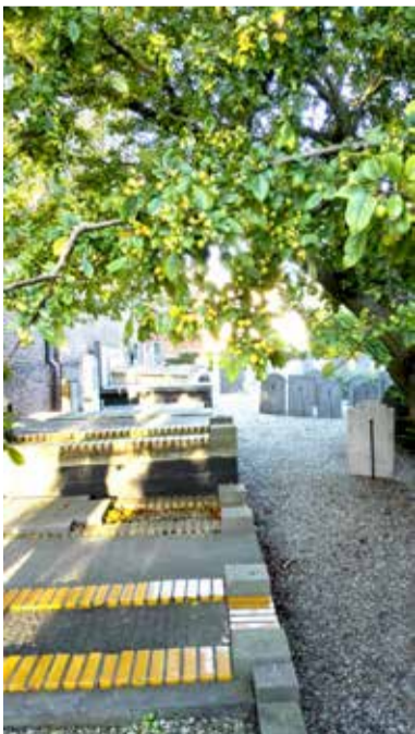
Kerkhof Oude Kerk

Van de graftuin achter de Nicolaaskerk weten de meeste Zoetermeeders niet eens van het bestaan, verscholen als die ligt tussen kerk en Pastoorsbos. Deze dodenakker is onlangs helemaal tot letterlijk groen rustpunt gerenoveerd. Sinds 1974 wordt er niet meer begraven, alleen in de familiegraven. De prijzen voor een begrafenis achter de Nicolaaskerk liepen in de vorige eeuw uiteen van fl. 1,50 voor de vijfde klas tot fl. 20 eerste klas.