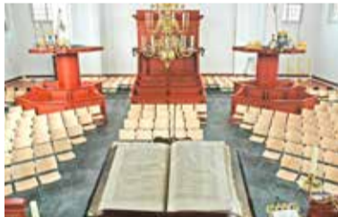
Zo is het sinds zondag 24 februari.