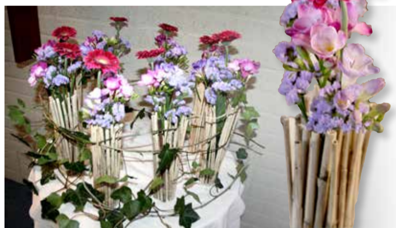
Klimop staat voor trouw, riet voor kwetsbaarheid.

IMPRESSIE • Bij kerkelijke hoogtenpunten als Pasen, Pinksteren en Kerst wordt in wijkgemeente De Oase extra aandacht aan de bloemen besteed, waarbij de liturgische kleur en periode van het jaar symbolisch tot uitdrukking wordt gebracht.